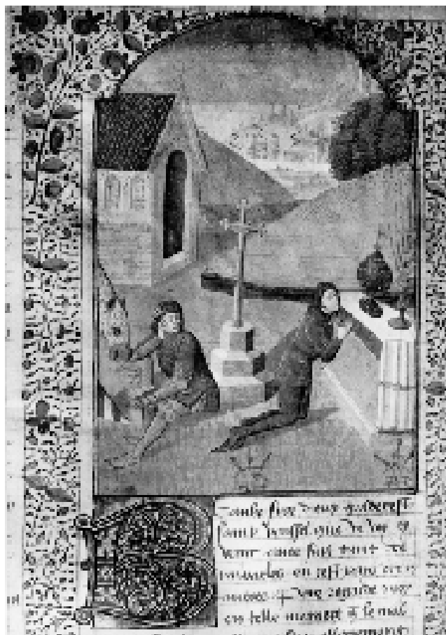
Persivalis ir Galachadas su Gralio taure. Miniatiūra. Paryžiaus Nacionalinė biblioteka

žygiams: naujosios riterijos pašlovinimas“). Šiuo tekstu, kurį Bernardas parašė vienam iš Templierių ordino įkūrėjų, savo bičiuliui Hugonui iš Payens, Klervietis išdėsto, koks turėtų būti tikrasis „Kristaus riteris“, bei piešia alegorinį Jeruzalės paveikslą. Tikrasis riteris, pasak jo, kovoja dėl Kristaus ne tik su išorės priešais, bet pirmiausia su savo paties ydomis, ir, perfrazuojant patį Bernardą, „jo sielą saugo tikėjimo skydas, o kūną – plieno šarvai, ir jis visuomet pasirėngęs aukotis vardan Kristaus“. Šis tekstas, parašytas XII a. raginant į Kryžiaus žygius, neabejotinai buvo aktualus ir XIII a. pirmoje pusėje: Laterano IV Susirinkimas numatė Kryžiaus žygį 1217 m., kuris, tiesa, neįvyko dėl popiežiaus Inocento III mirties (1216). Nepaisant to, ir vėliau dar buvo rengiami Kryžiaus žygiai, bet jau ne vien tik į Šventąją Žemę, Palestiną, bet ir kovai prieš įvairias erezijas, pirmiausia prieš katarus.