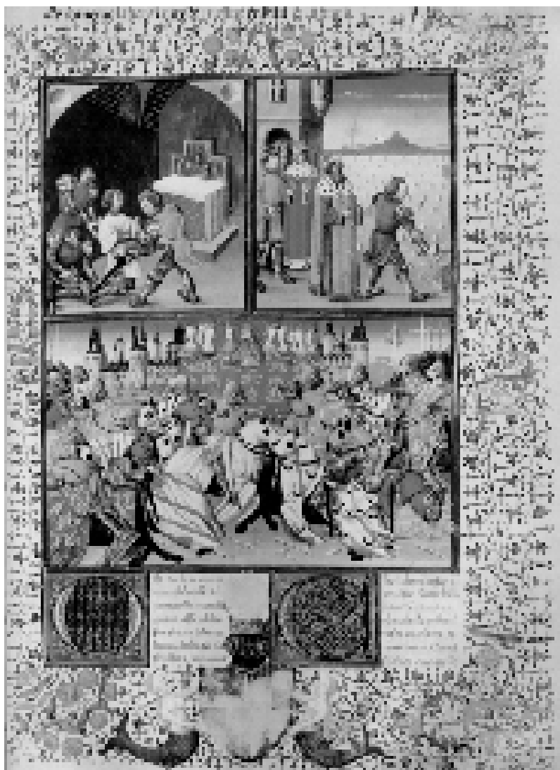
Galachado gyvenimo scenos. Miniatiūra. Paryžiaus Nacionalinė biblioteka

Juozapas iš Arimatėjos, kurį buvo pasamdęs Poncijus Pilotas, prašo jo už savo atliktą karinę tarnybą atiduoti Kristaus kūną. Pilotas ne tik patenkina Juozapo prašymą,